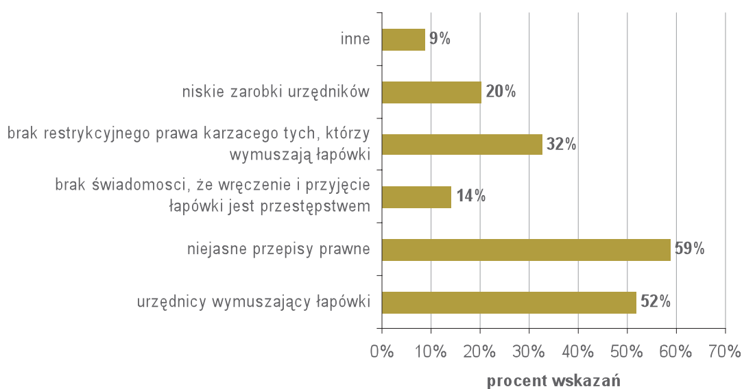
Rys 3. Co Pana/Pani zdaniem najbardziej wpływa na korupcję w budownictwie?

Wśród innych czynników wymienianych w ankietach, dość często pojawia się przyzwolenie społeczne (w tym przeświadczenie, że za pomocą łapówki można dużo załatwić) i brak otwartej dezaprobaty zjawiska a także trudności w udowodnieniu przestępstwa. Ankietowani zwracają również uwagę na niedoskonałość prawa (które jest m.in. zbyt szczegółowe, zbyt łagodne dla dających i zbyt ostre dla dających) oraz jego słabą znajomość przez inwestorów. Pojedyncze osoby wskazały na: monopolistyczną pozycję firm energetycznych i zaopatrujących w wodę, zbyt dużą ilość koncesji, brak planów zagospodarowania przestrzennego i partyjną ordynację wyborczą w samorządach.